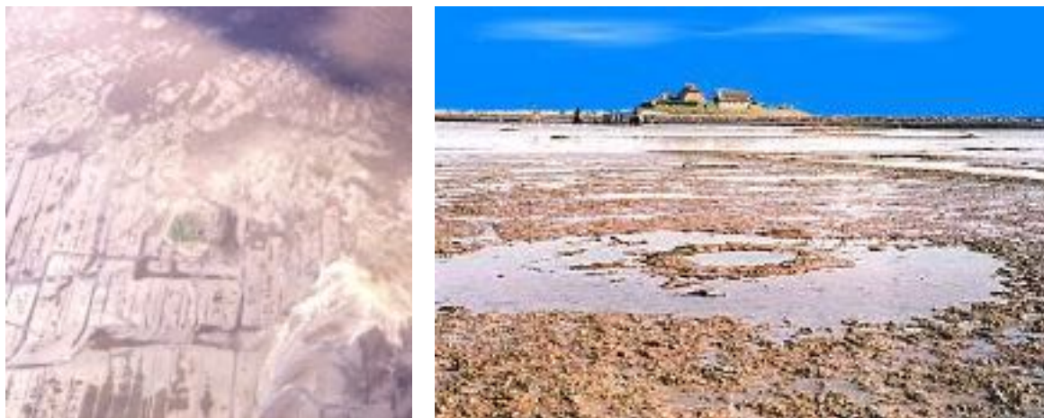
D'anciennes traces d'utilisation dans le "Watt" (bas-fond/ lagune)

Platon nous dit plus loin : “Ainsi, la mer est maintenant là où l'on ne pouvait plus traverser en bateau car c'était devenu impraticable : l'île avait laissé des hauts fonds vaseux lors de son effondrement” .