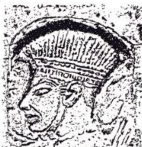
Les Peuples de la mer : chassés par Sekhmet

Le cataclysme de la fin du XIII e siècle avant J.-C. a causé partout sur son passage la désolation et la misère, ruinant et chassant des peuples entiers de leurs terres ancestrales. Certains de ceux-ci se regroupèrent pour former les fameux Peuples de la mer, cohorte hétéroclite de guerriers en quête de nouveaux territoires. Ce personnage qui figure sur les bas-reliefs de Médinet Habou a une coiffe caractéristique des peuples germaniques, comme l'a montré J. Spanuth et est probablement venu des contrées du nord-ouest de l'Europe. On sait par les textes que les pays du neuvième cercle ont été totalement dévastés par un grand cataclysme : le Ragnarök, parvenu jusqu'à nous sous forme de mythe. » M.A. Combes/ < astrosurf.com/macombes >.