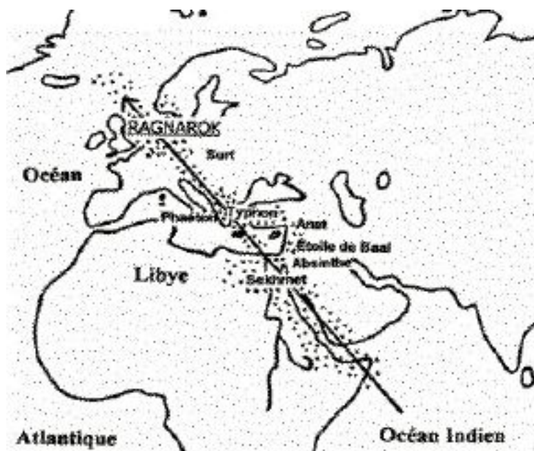
Figure 19-3. Trajectoire de la comète-astéroïde Sekhmet

L'épopée cosmologique du Ragnarök est particulièrement intéressante pour qui étudie, comme nous, les cataclysmes cosmiques de l'Antiquité. Elle est aujourd'hui définitivement associée au dernier grand cataclysme cosmique qu'a subi la Terre et qui a eu lieu à la fin du XIII e siècle av. J.-C., et dont nous parlerons en détail au chapitre 19. Surt, Sekhmet, Typhon, Phaéton, Absinthe, Anat et d'autres encore sont les noms différents de l'objet cométaire (ou d'origine cométaire) qui est entré en collision avec la Terre, à une époque où de nombreuses civilisations étaient déjà bien en place et prospéraient, semant tout au long de son parcours la panique, la ruine et la mort. C'est ce même cataclysme qui est associé à l'Exode des Hébreux et aux dix plaies d'Égypte et que nous retrouverons au chapitre 2, sous un éclairage assez différent : l'éclairage biblique.