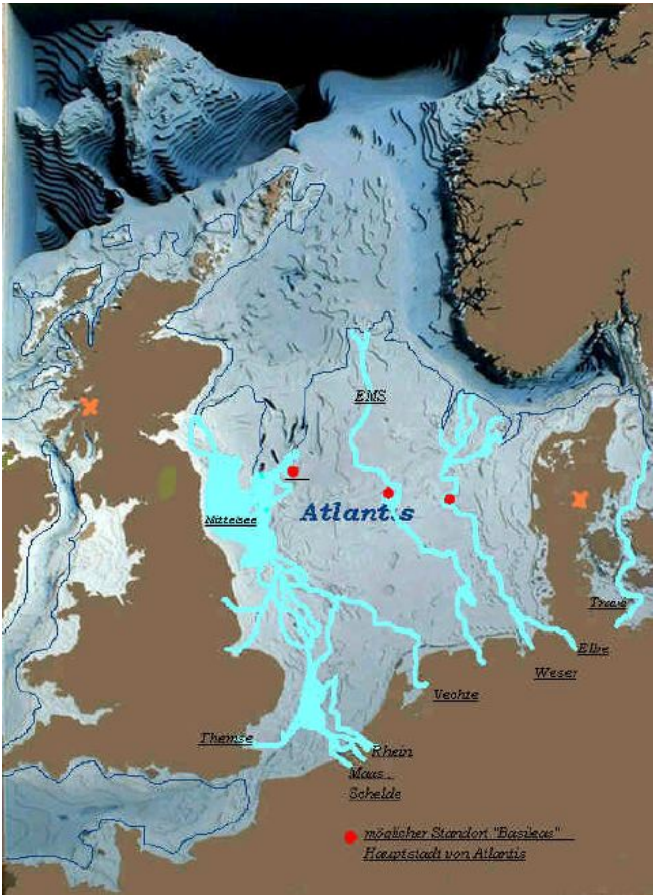
La cartographie d'Atlantis dessinée d'après un profil des reliefs de la Mer du Nord