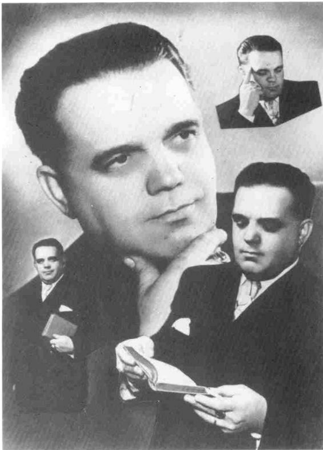
Franz BARDON « La pratique de la magie évocatoire »