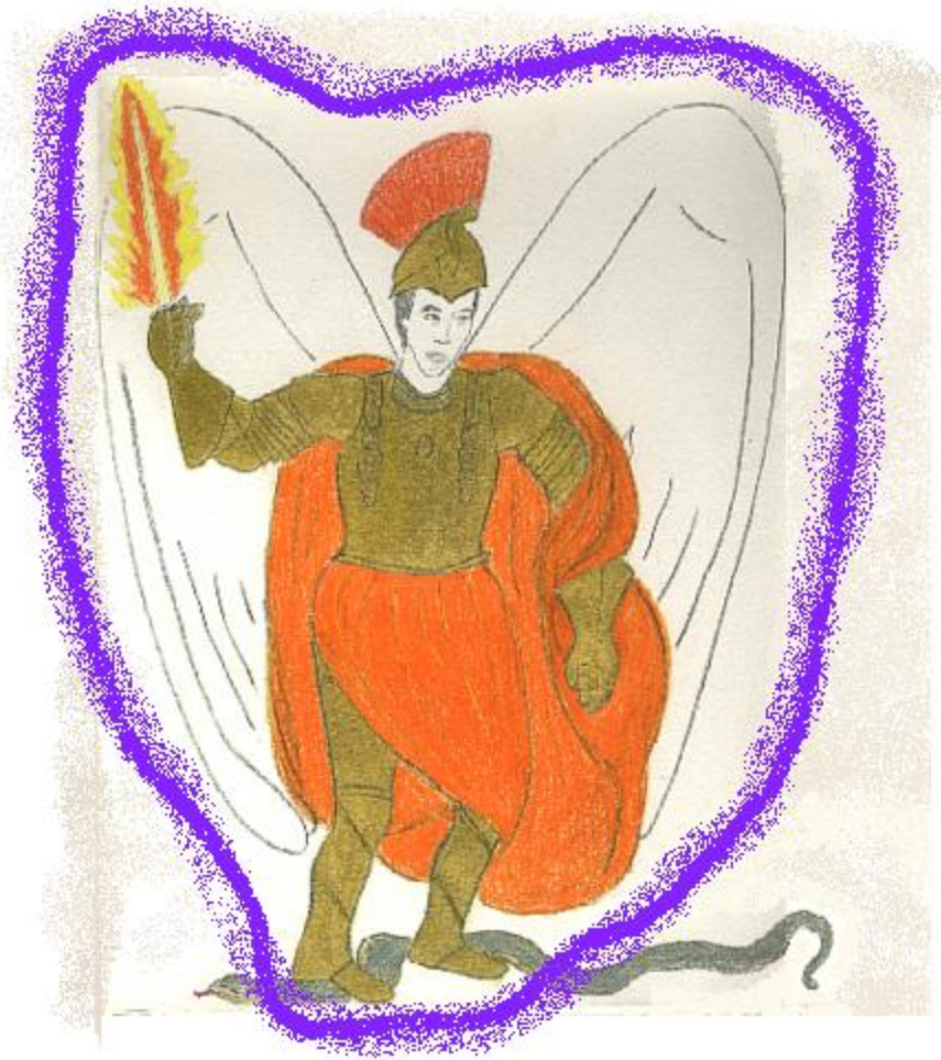
Image Télématique de l'Archange MICHAEL