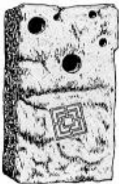
La pierre de Suèvres

Vers l'an 1800 on découvrit, près de l'église Saint-Lubin, à Suèvres (Loir-et-Cher), localité située au bord de la Loire et aux confins de l'ancienne forêt d'Orléans, un bloc de pierre de 1 mètre 50 sur 0,95 M, grossièrement équarri et dont une face aplanie portait une curieuse gravure et un certain nombre de cavités ou cupules.