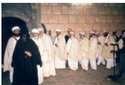
Figure 2 - Danse rituelle (Sema) des Yezidis

Ce serpent est loin d'être le symbole du mal, comme dans nos traditions, mais se réfère à l'antique doctrine de la régénération par la mue. En arabe, serpent se dit « hayyat » qui se rapproche du mot « hayyat », vie. Le sens du serpent noir serait donc : « Sagesse de la vie ».