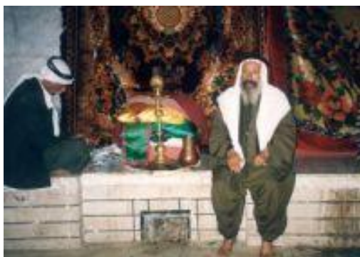
Figure 3 - Sanctuaire du Paon à Lalish

La principale fête Yezidis est la Fête de Lam en octobre, durant laquelle les fidèles se rendent en pèlerinage sur la tombe de sheikh Adi à Lalish. Cette fête est une célébration de la Création et prend place à la même époque que les anciens rites zoroastriens ou mithraïques. D'ailleurs, l'anniversaire de la naissance de Melek Taus est fêté à la mi-décembre, ce qui rappelle la fête du Sol invictus de Mithra et des autres grandes figures divines solaires, comme le Christ.